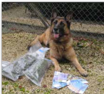
Spielzeug, das nach Drogen riecht

Beim Laufen hinkt Nyra ein wenig. Kein Wunder, sie hat schon 13 Jahre auf dem Buckel. Und in denen hat sie einiges geleistet.